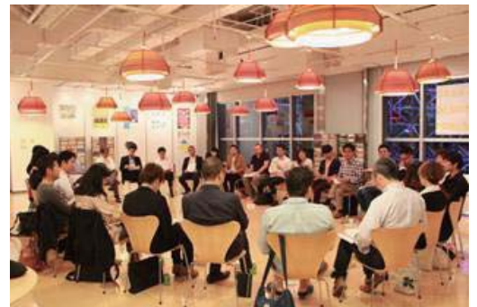
コーディネーター会議

連携・協業は必ず、人と人の出会いをきっかけに生まれることから、メビック扇町では、クリエイティブ関係者のみならず、多方面で活躍する人材とともにクリエイター支援に取り組んでいます。中核的な組織として、大阪府内の現役クリエイター27人がコーディネーターとして府内クリエイティブ企業や個人を訪問。さらに、今回新たに就任したメンターや全国に広がるエリアサポーター（大阪のクリエイティブ産業を発信する応援団）、取材・発信を担う取材チームも合わせると、サポート体制は総勢約240人に。当施設独自に築いた「人が人を呼ぶ」循環を活かし、産業活性化に取り組み、ひいては大阪全体の活性化に貢献することを目指します。