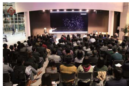
「これからのクリエイターに必要なプロデュース力」