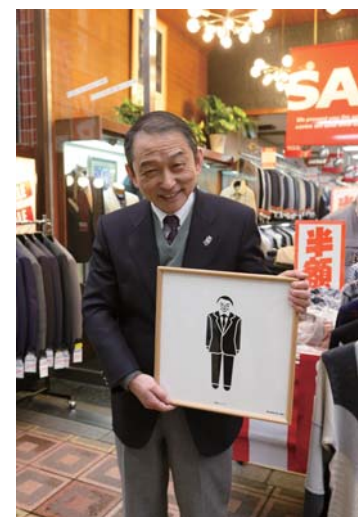
商店用ピクトグラム一例

最近の事例では、メビック扇町を介して出会った商店街のコンサルタントとグラフィックデザイナー鈴木信輔氏が、情報を視覚的な図で表現する「ピクトグラム」を制作することで、商店街を活性化する協働プロジェクトがあります。顧客とお店のコミュニケーションのきっかけになるよう、一店ずつインタビューして各商店の強みを再整理し、それを表すようデザインした各商店用と、商店街のにぎわいにつながるよう、下町の雰囲気を中心にデザインした交通案内や営業時間などの公共用の2種のピクトグラムを開発。丁寧な案内で外部の人も入りやすく、入った人がお店の人と話しやすい雰囲気を作ることで商店街の活性化を図った事例で、9月末にHPのコラボ事例にも掲載予定です。