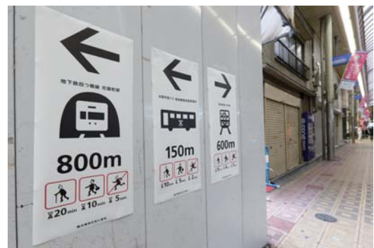
公共用ピクトグラム一例

大阪のクリエイティブ企業は約14,000社(総務省「経済センサス」平成21年版)と、東京に次ぐ全国2番目の集積があります。メビック扇町は、これら大阪のクリエイターの活性化を図るため、クリエイターの情報発信、ネットワークづくり、ビジネスマッチング、人材育成に取り組んでいます。ニーズとシーズを合わせるだけの仕事のマッチングではなく、人がつながり信頼関係を築くことで、良好な関係に基づく協働が生まれるという考えのもと、“顔の見える”関係づくりを進めてきました。その結果生まれた協働事例は、メビック扇町のHPに7月5日にオープンしたコラボ事例のコーナー( http://www.mebic.com/collabo/ )や、年に一度発行している冊子「OSAKA CREATORS」などで、今後も順次発信していきます。