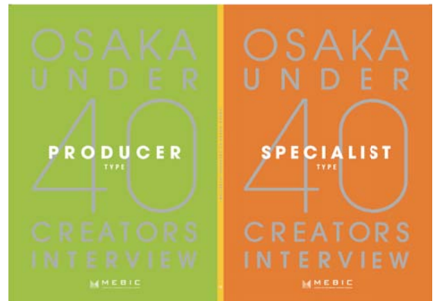
プロデューサータイプ、スペシャリストタイプを 両側から読めるダブル表紙仕様

メビック扇町は、約13,000社のクリエイティブ関連企業が集積する大阪のクリエイティブ産業のさらなる活性化を目指し、クリエイターの情報発信やネットワークづくりのサポート、ビジネスマッチング、人材育成などに取り組んでいます。さまざまなタイプ、年代のクリエイターがいる中、当冊子では、次世代のクリエイティブシーンをリードしていく40歳以下の若手クリエイターの活躍に注目、さらに、大きく2種類のタイプに分けて紹介します。ひとつは、企画・構想段階から、ネーミング、デザイン、ブランディング、情報発信、ときには販路の獲得、拡大までを見据え、総合的な視点をもって動く「プロデューサータイプ」。もうひとつは、得意分野の技術を唯一無二なレベルにまで高め、この人でなくてはならないと周りから求められる「スペシャリストタイプ」です。