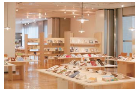
「my home town わたしのマチオモイ帖」2014年大阪展

「マチオモイ帖プロジェクト」は、日本各地のクリエイターが、それぞれ思い入れのある町やそこに住む家族や周囲の人への想いを、冊子や映像に綴り、人々に届ける活動です。東日本大震災が発生し、誰もが足元を見つめ直した2011年に始まり、今では総作品数約1200帖。東京、大阪ほか各地で展示会を開催し、約62万部発行のゆうちょ銀行カレンダーのデザインにも4年連続採用されるなど、その知名度は年々高まっています。