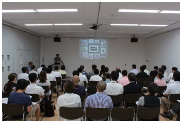
2014年7月14日開催 「企業などによるクリエイター募集プレゼンテーション」

2011年度からは、ビジネスマッチングの機会として、クリエイターを探す企業によるプレゼンテーションを開始。これまでに22回開催し、84社の企業・団体が参加、企業ロゴ、ウェブサイト制作、新商品開発など様々な協働が生まれています。