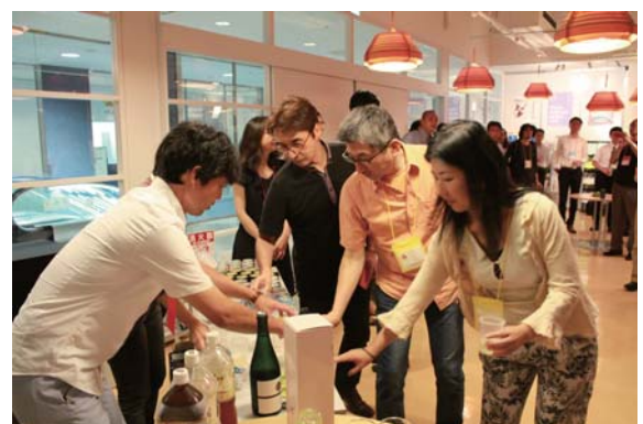
2014年6月27日に開催された「企業などによるクリエイター募集プレゼンテーション」

その第1歩として、まずは農業に関心のあるクリエイターに生産現場を実際に体感、農業者の生の声に触れてもらい、また農業者にも“デザイン”を視野に入れた農業を考えていただく契機として、今回のイベントが企画されました。当日は、現地を見学するほか、意見交換会も行われる予定です。