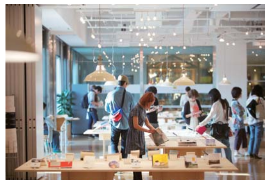
会場でマチオモイ帖を見入る来場者

本展示会は、クリエイターがマチオモイ帖の制作を通して自己を見つめ直し、新たな気づきを得ると共に、来場者の心にもある、大切に思う町や人を呼び喚ますきっかけになることを目指し、全国のクリエイターに展示会への参加を呼び掛けています。