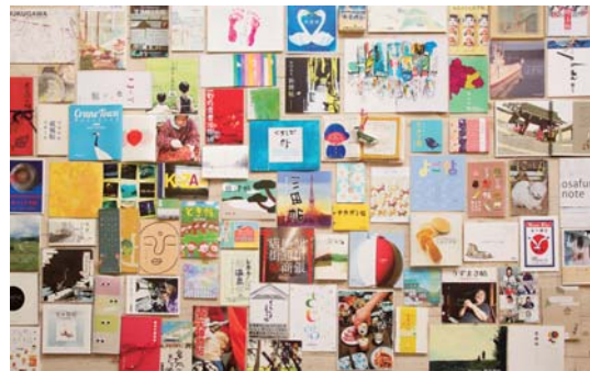
大きさや形も違う多彩な冊子群

2011年3月11日に発生した東日本大震災は、家族や友だち、地域とのつながりなど、自分を育ててきた大切なものを、日本人が見つめ直すきっかけとなりました。同年6月に「クリエイターが社会に対してできること」をテーマにメビック扇町でマチオモイ帖34作品を展示。これが反響を呼び、2012年には東京ミッドタウンでも開催しました。さらに、今年2月には全国13地域22カ所まで開催地が拡がり、作品数は当初の20倍近くになる約650帖に増えています。